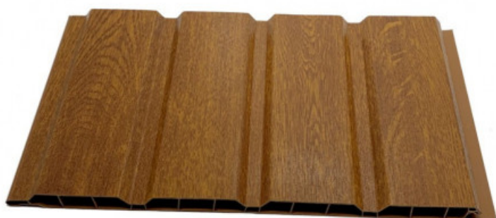
Planche de 25 cm x 4 mètres