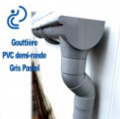
Gouttière PVC demi-ronde Gris Pastel