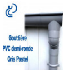
Gouttière PVC demi-ronde Gris Pastel