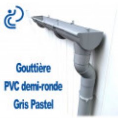
Gouttière PVC demi-ronde Gris Pastel