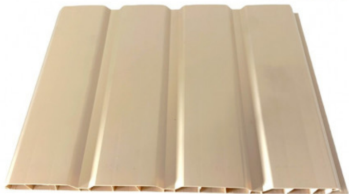
Planche de 25 cm x 4 mètres