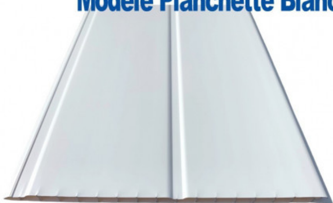
Planche de 25 cm x 4 mètres