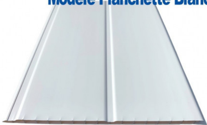
Planche de 25 cm x 4 mètres